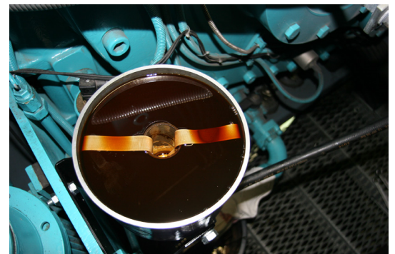
Das Triple-R-Element entfernt Partikel, Wasser und Lack