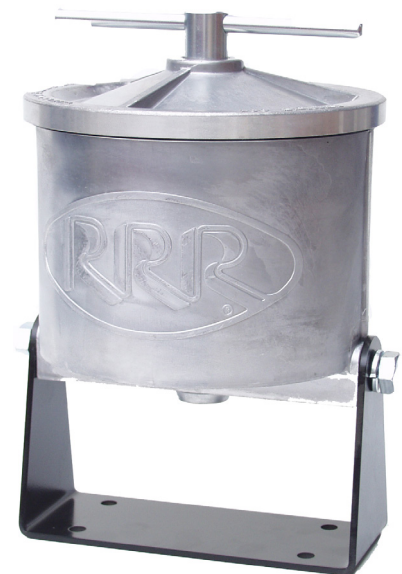
Bypassölsäurereiniger der Serie Triple R AL

Triple R dient Ihrer Bequemlichkeit, nicht nur, weil wir Ihr Öl und Ihre Maschine im bestmöglichen Zustand halten, sondern auch, weil wir bei Triple R davon ausgehen, dass einfache Verwendung genauso wichtig ist. Der Austausch eines Elements in einem unserer Standardsysteme dauert nur 3 Minuten, ohne Auslaufen und ohne Reinigen! Beim Wechsel von Triple-R-Elementen sehen Sie die größten Partikel oben auf dem Filterelement. Dies ist ein weiterer sehr nützlicher Vorteil von Triple R, da es als Sichtprüfung verwendet werden kann.