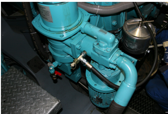
Installation eines Triple-R-Systems zur ständigen Ölreinigung

In Hydrauliksystemen hilft sauberes Öl den (Servo-)Ventilen, Pumpen und Zylindern gleichermaßen. Je sauberer es ist, desto zuverlässiger läuft Ihre Maschine und deren Produktion. Beispielsweise leiden Ventile stark unter verunreinigtem Öl. Dies gilt vor allem bei Lackresten, die zu Kleben führen und proaktive Wartungsarbeiten verlangen oder, schlimmer noch: Ausfälle verursachen. Mit Triple R entfernen wir nicht einfach nur (Feststoff-) Partikel, die bis zu 0,1 Mikron klein sind, sondern auch Wasser. Darüber hinaus ist Triple R das einzige Bypassfiltersystem, das mit demselben Element aktiv Lack entfernt und reduziert.