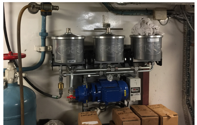
Installation des SE300-Bypass-Kraftstoffreinigers am Kraftstofftank