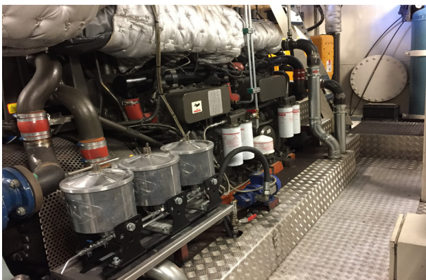
Triple R AL300 Bypass-Ölreiniger am Hauptmotor

Beispielsweise sind Hauptmotoren, Getrieben und Generatoren stark von sauberem Öl abhängig. Die Reinigung des Öls verringert die Abnutzung stark. Je sauberer es ist, desto zuverlässiger und besser läuft Ihre Maschine. Mit Triple R entfernen wir nicht einfach nur (Feststoff-) Partikel, die bis zu 0,1 Mikron klein sind, sondern auch Wasser. Darüber hinaus ist Triple R das einzige Bypassfiltersystem, das mit demselben Element aktiv Schlamm entfernt und reduziert.