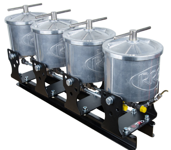
Bypassölsäurereinigungssystem der Serie Triple R AL für Hauptmotoren

Triple R dient Ihrer Bequemlichkeit, nicht nur, weil wir Ihr Öl und Ihre Maschine im bestmöglichen Zustand halten, sondern auch, weil wir bei Triple R davon ausgehen, dass einfache Verwendung genauso wichtig ist. Der Austausch eines Elements in einem unserer Standardsysteme dauert nur 3 Minuten, ohne Auslaufen und ohne Reinigen! Beim Wechsel von Triple-R-Elementen sehen Sie die größten Partikel oben auf dem Filterelement. Dies ist ein weiterer sehr nützlicher Vorteil von Triple R, da es als Sichtprüfung verwendet werden kann.