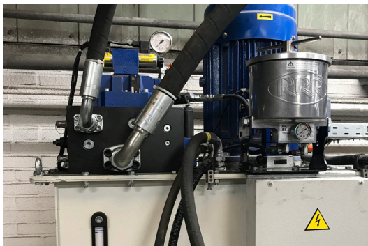
Triple R BU100 Bypass-Ölreiniger am Powerpack

In Hydrauliksystemen hilft sauberes Öl den (Servo-)Ventilen, Pumpen und Zylindern gleichermaßen. Je sauberer es ist, desto zuverlässiger läuft Ihre Maschine und deren Produktion. Beispielsweise leiden Ventile stark unter verunreinigtem Öl. Dies gilt vor allem bei Lackresten, die zu Kleben führen und proaktive Wartungsarbeiten verlangen oder, schlimmer noch: Ausfälle verursachen. Mit Triple R entfernen wir nicht einfach nur (Feststoff-) Partikel, die bis zu 0,1 Mikron klein sind, sondern auch Wasser. Darüber hinaus ist Triple R das einzige Bypassfiltersystem, das mit demselben Element aktiv Lack entfernt und reduziert.