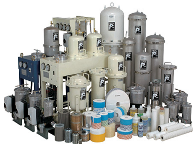
Triple-R-Bypass- und Offline-Ölreiniger

Triple R dient Ihrer Bequemlichkeit, nicht nur, weil wir Ihr Öl und Ihre Maschine im bestmöglichen Zustand halten, sondern auch, weil wir bei Triple R davon ausgehen, dass einfache Verwendung genauso wichtig ist. Der Austausch eines Elements in einem unserer Standardsysteme dauert nur 3 Minuten, ohne Auslaufen und ohne Reinigen! Beim Wechsel von Triple-R-Elementen sehen Sie die größten Partikel oben auf dem Filterelement. Dies ist ein weiterer sehr nützlicher Vorteil von Triple R, da es als Sichtprüfung verwendet werden kann.