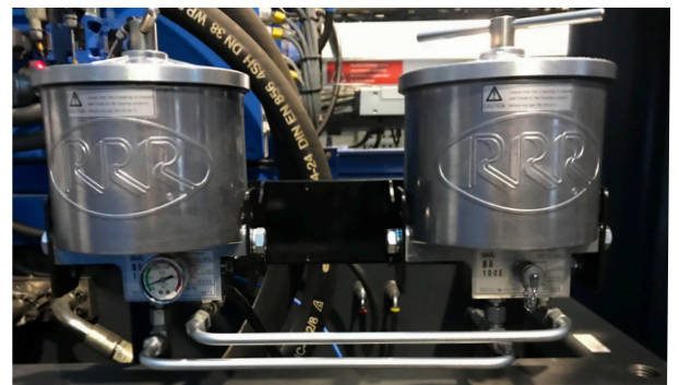
Triple R BU200 Bypass-Ölreiniger an der STORK-Maschine